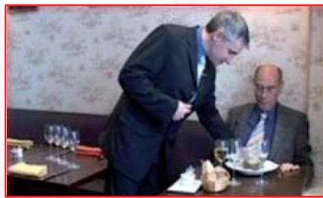
Employé de restaurant