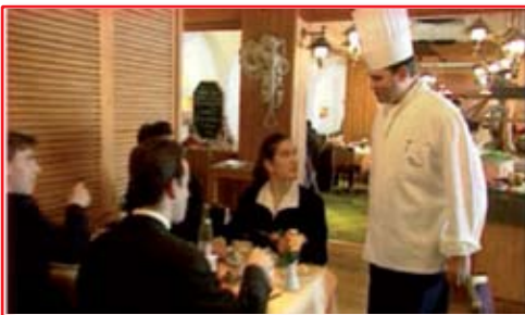
Chef de cuisine