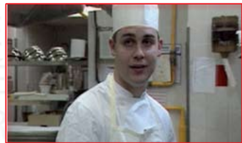
Chef de partie