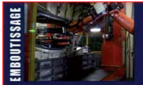
Comment fabrique-t-on une automobile ?