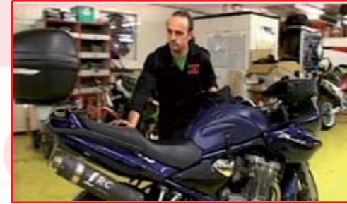
Le mécanicien en motos