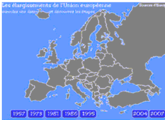
Les principaux élargissements